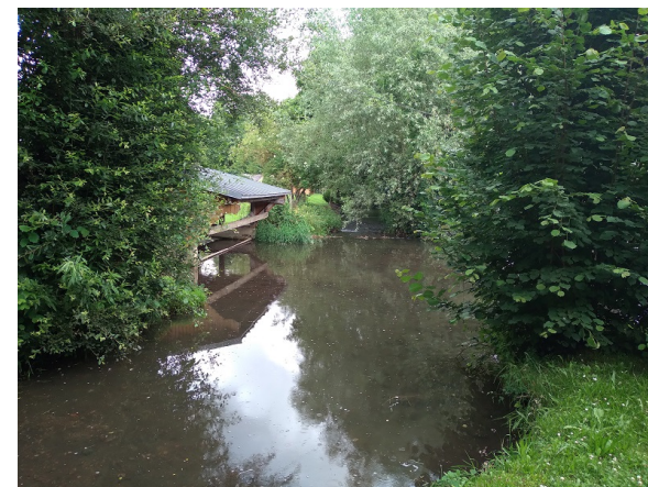
Lavoir de Saint-Elier