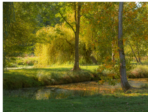
Les moulins-iton