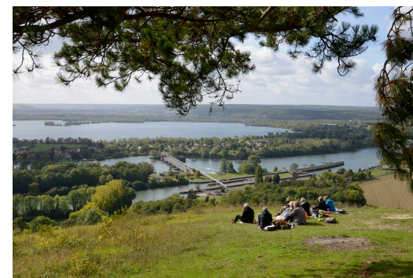
2019-08_Randonnée Cote des 2 amants 12